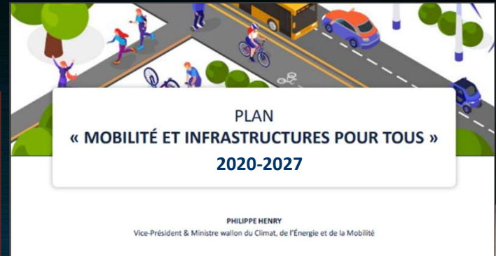
Tableau de bord de la mobilité en Wallonie